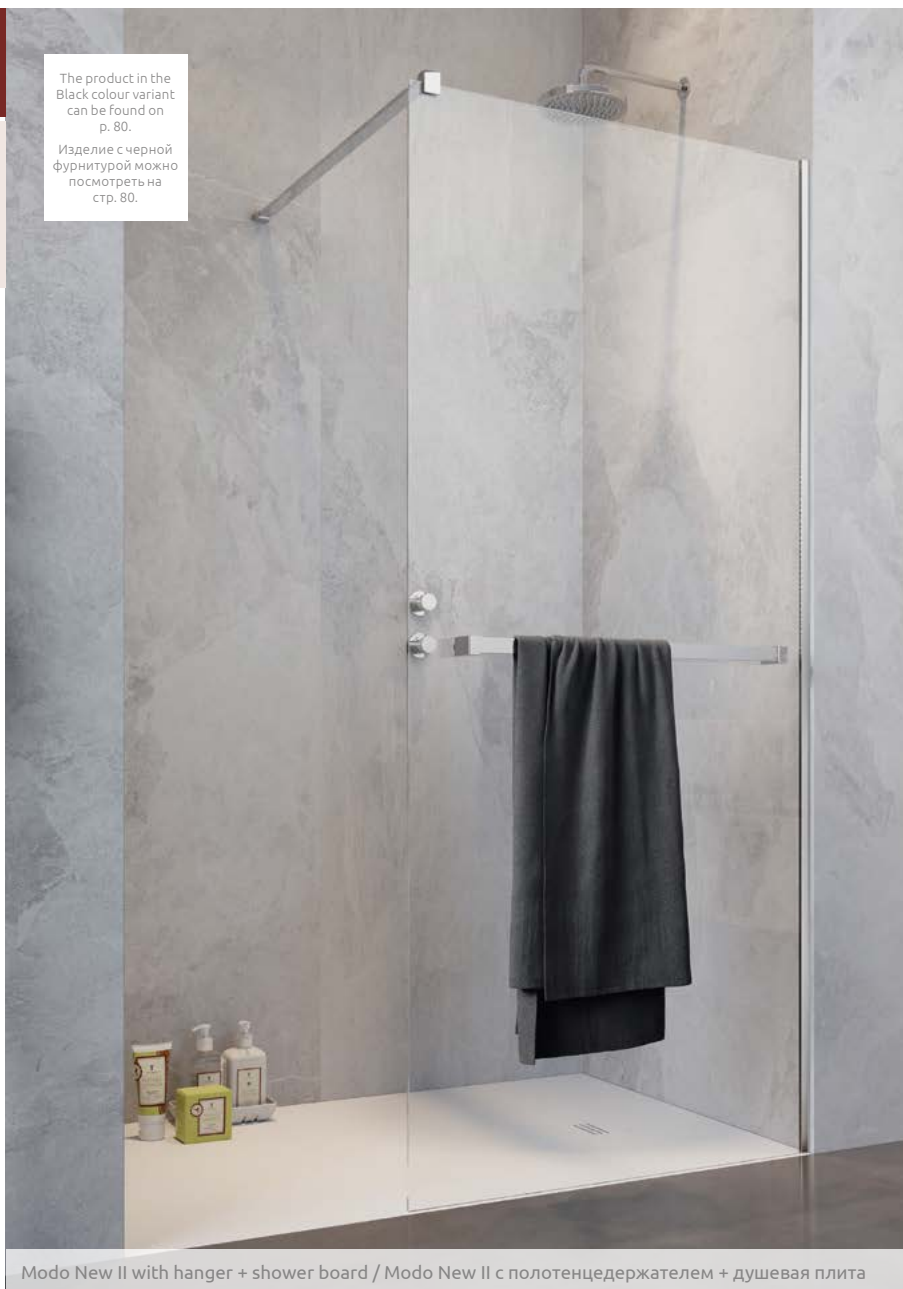
Modo New II with hanger + shower board / Modo New II с полотенцедержателем + душевая плита

The product in the Black colour variant can be found on p. 80. Изделие с черной фурнитурой можно посмотреть на стр. 80.